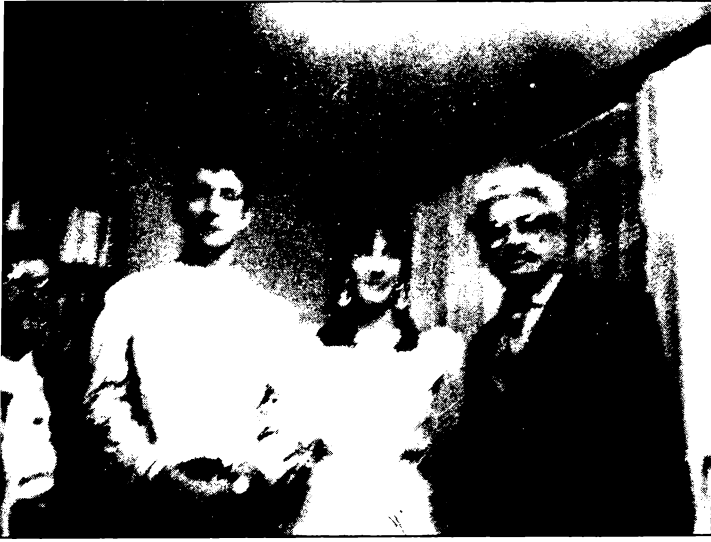
سبة الاحتفال بزواج ى فى أيلول ١٩٩٣ راغ